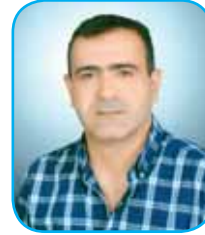
CebraİL ALDI Yönetim Kurulu Üyesi