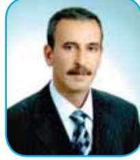
Sami PAYZA Meclis Başkanı